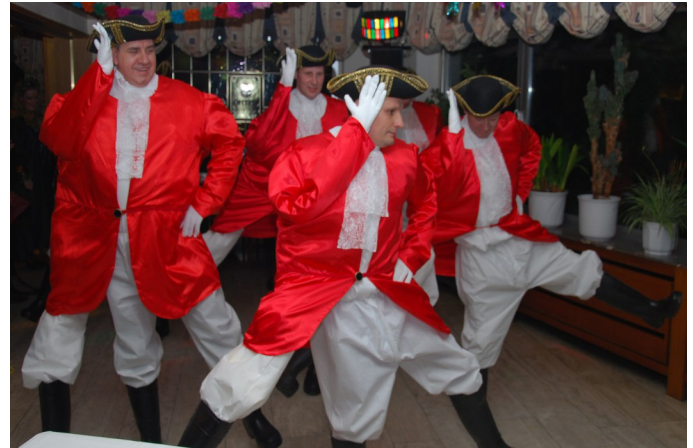
Jeder Tänzer hat drei Beine!