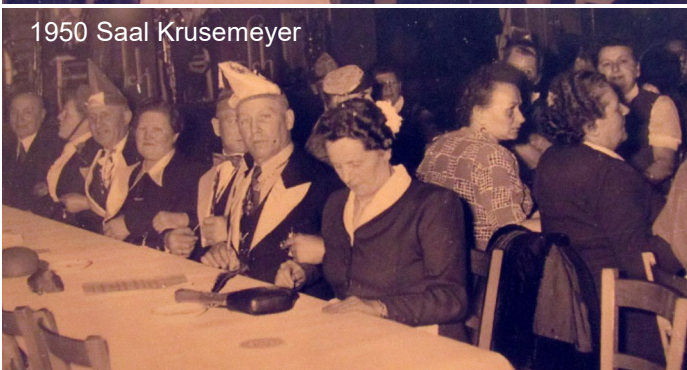
1950 Saal Krusemeyer