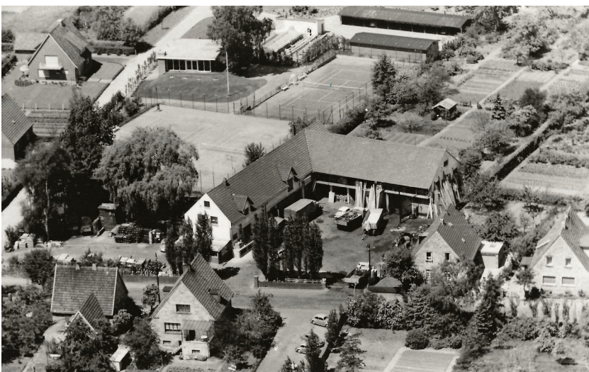
Gartenstraße/Südstraße, Baustoffe Bergschneider, Tennisplätze, ca. 1968, heute Agentur für Arbeit

19.01.1947 Der Teggeldag wurde am 19.01.1947 um 15 Uhr im Saale Krusemeyer ordnungsmäßig einberufen. Da der Fastnacht auf sein 25-jähriges Bestehen zurückblicken kann, wurde durch die Mehrheit beschlossen, das Fastnachtsfest in altgewohnter Weise zu feiern. Das Fest selbst nahm einen harmonischen und durch Mangel an Alkohol zum Teil einen soliden Verlauf. Späterhin wurde die Stimmung durch die Kälte des Saales etwas gedrückt.