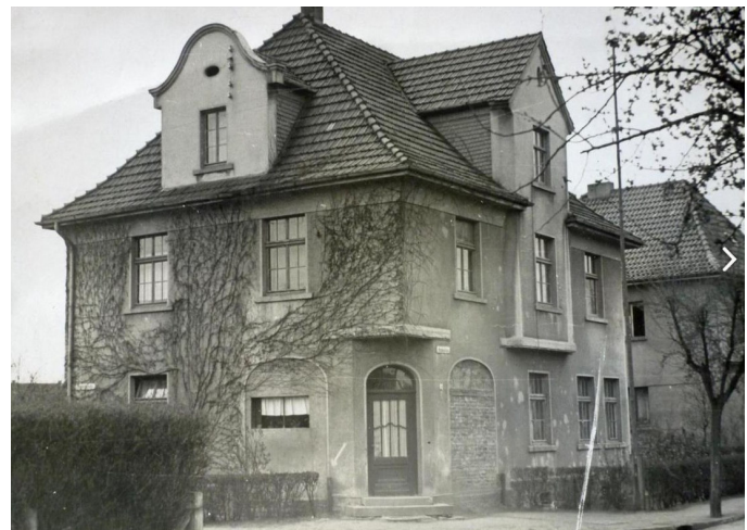
Gartenstraße Haus Höfle um 1950