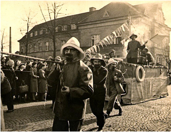
Die Aa-Schiffer an der alten Post, ca. 1951