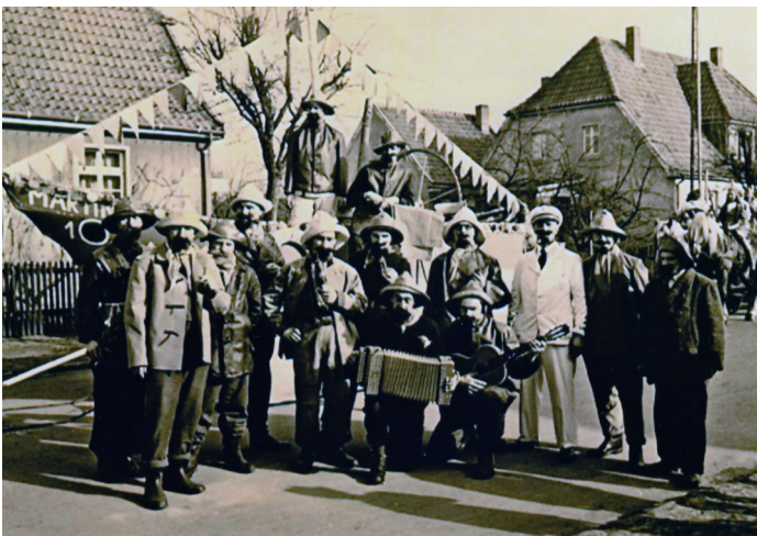
Die Aa-Schiffer in der Arenbergstraße, ca. 1951