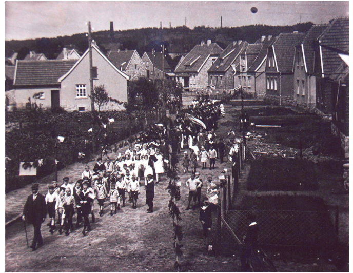
Festumzug durch die Arenbergstraße ca. 1930, Schützenfest des SV Südfeldmark