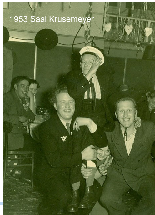
1953 Saal Krusemeyer