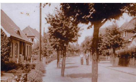
Die Gartenstraße in den 60er Jahren